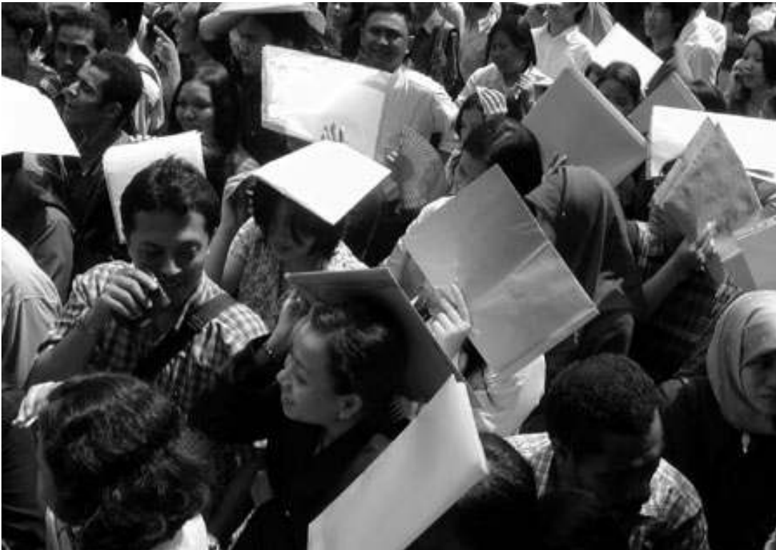
ketenagakerjaan menjadi salah satu masalah penting yang harus diselesaikan

saja mengandaikan peran aktif negara, baik itu berupa alokasi dana maupun dukungan lain.