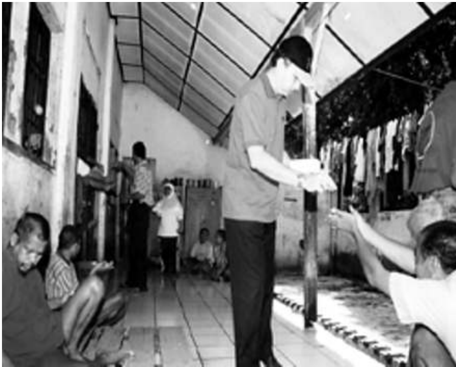
Kondisi pasien salah satu RS Jiwa yang memprihatinkan

Adanya pergeseran tanggung jawab ini tentu mengandung resiko besar dalam hal implementasi kewajiban hak asasi negara. Pelaksanaan tanggung jawab hak ekosob pada akhirnya akan memperhitungkan kemampuan sumberdaya daerah. Jakarta sebagai daerah paling besar Anggaran Pendapatan dan Belanja Daerah (APBN) di seluruh Indonesia telah memberikan alokasi yang jelas dalam penanganan orang gila. Dalam sebuah Surat Keputusan (SK) Gubernur disebutkan bahwa setiap penderita gangguan jiwa mendapat jatah makan sebesar Rp 15.000/hari selama masa pelayanan di panti sosial.