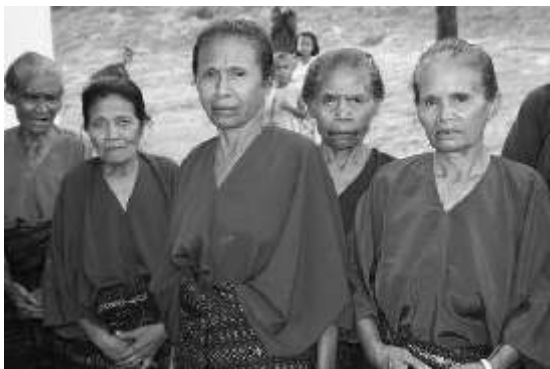
Perempuan di Manggarai, Flores - NTT akan menghadapi masalah baru dengan dibukanya pertambangan