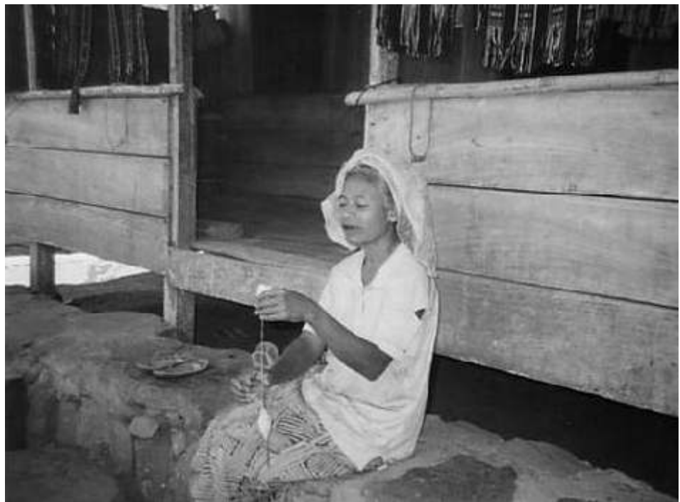
Otonomi daerah harus membuat masyarakat lebih sejahtera

sebagaimana yang diharapkan. Banyak kelompok tertentu baik di pusat maupun di daerah, yang masih mempermasalahkannya. Misalnya, muncul kampanye negatif bahwa kebijakan otonomi daerah akan mengancam integrasi nasional, menguatnya primordialisme daerah, condong kepada money politic , otonomi daerah berubah menjadi otomoney , dan terjadinya “ money follows function ”, yaitu penggunaan anggaran tidak sesuai fungsinya. Padahal, penjagaan integrasi nasional, dan rentetan masalah otonomi daerah itu bukan semata-mata kewajiban pemerintah pusat, tetapi juga