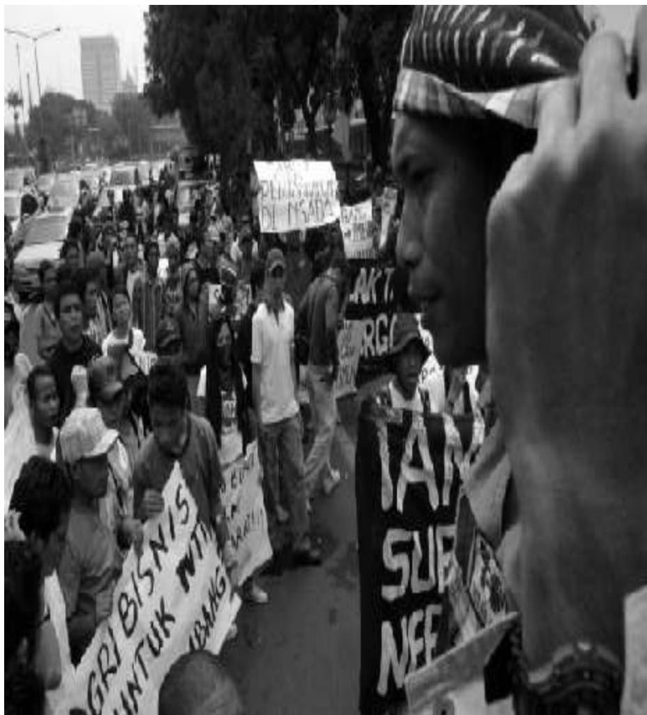
Warga menentang adanya pertambangan di NTT

(Kalimantan Timur) akan terjadi juga di Flores, khususnya di Kabupaten Manggarai Barat yang saat ini sudah mengeluarkan ijin eksplorasi bagi PT. Sejahtera Prima Nusa atau PT Grand Nusantara di Batu Gosok, dan perusahaan tambang lainnya yang disebutkan di atas.