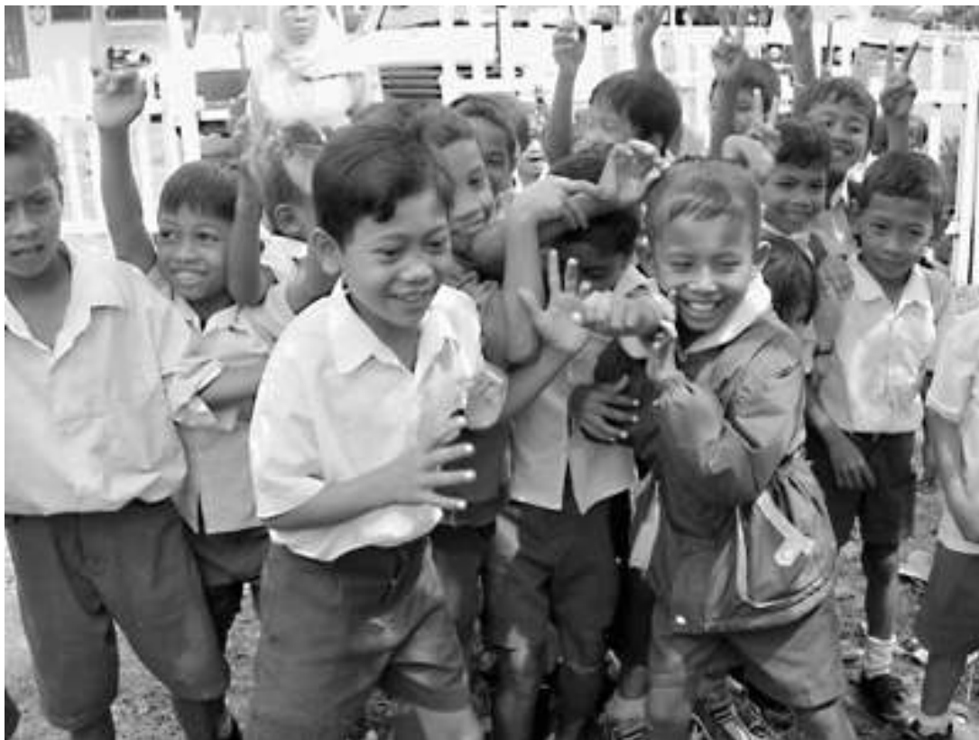
Dengan adanya Otonomi daerah diharapkan juga pembangunan pendidikan lebih baik

Untuk mengaktualisasi prinsip-prinsip ini, maka dalam penyelenggaraan pemerintahan baik di tingkat pusat maupun di daerah muncul konsep good governance . Konsep ini selain sebagai