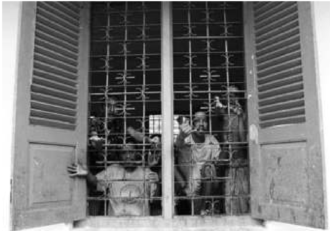
Kondisi pasien salah satu RS Jiwa yang memprihatinkan

Ada kesan yang cukup kuat bahwa urusan hak atas kesehatan juga hak bidang ekonomi, sosial, budaya (ekosob) lainnya seperti hak atas pendidikan telah diserahkan kewenangannya kepada pemerintah daerah. Pemerintahan lokal yang bertanggung jawab sepenuhnya terhadap implementasi kewajiban negara atas hak-hak ekosob. Akibatnya, tanggung jawab pemerintah pusat menjadi minimalis.