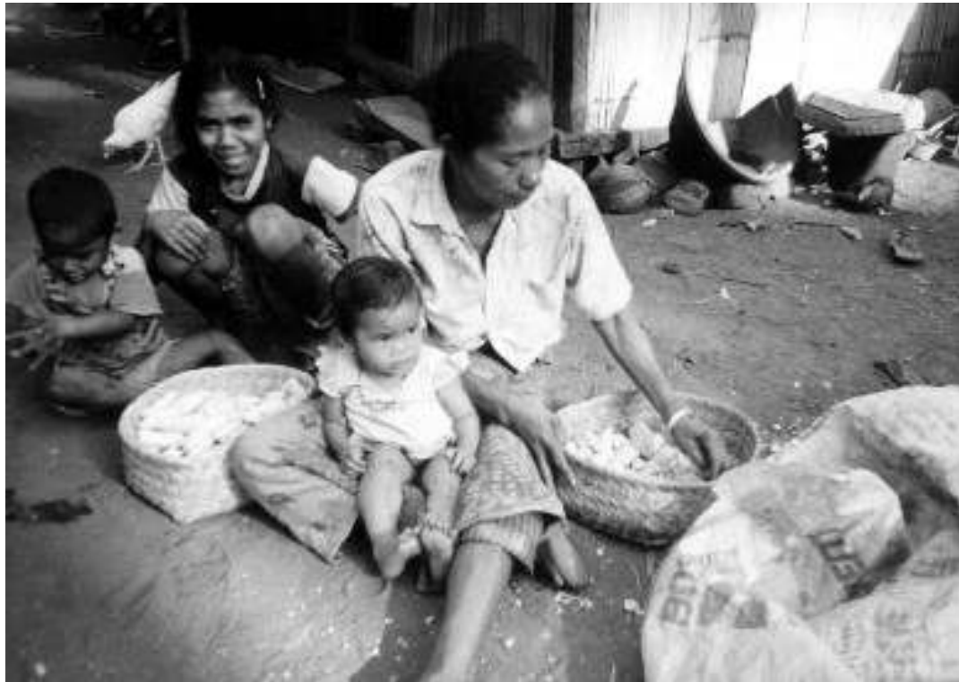
Kalangan masyarakat sipil menilai pemerintahan mendatang sulit menyelesaikan sisa persoalan periode sebelumnya akibat kebijakan propasar, salah satunya terkait pemenuhan hak ekonomi sosial budaya (ekosob).

Bagaimanapun, jika melihat sejarah gagasan dan pertimbangan lebih lanjut atas pemisahan dan gradasi dua hak itu tidak memadai. Dalam sambutan yang diberikan tahun 1941, presiden Amerika Serikat Franklin D. Roosevelt menyampaikan gagasan yang kemudian banyak mempengaruhi perumusan naskah Deklarasi Hak Asasi Manusia. Roosevelt menyampaikan