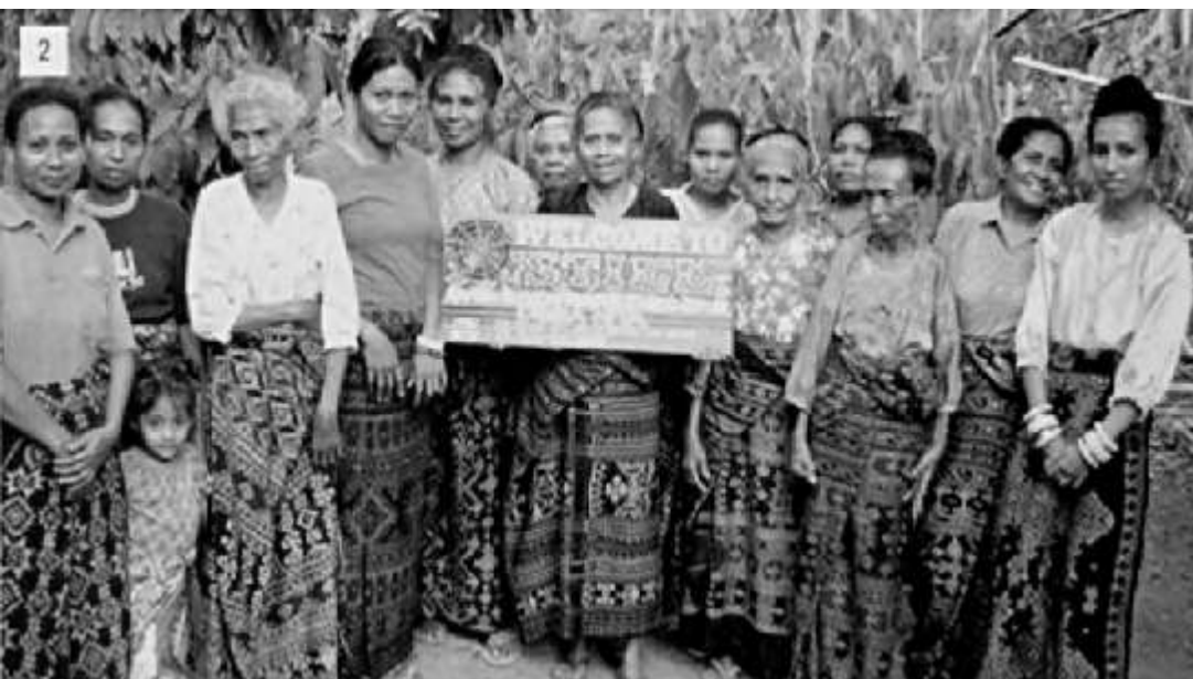
Kaum perempuan Flores yang sebagian besar adalah bekerja sebagai petani

Menurut hemat saya, GERAM memang merupakan organisasi yang sangat berbahaya, berbahaya bagi Pemerintah Kabupaten Manggarai Barat, namun tidak berbahaya bagi rakyat Manggarai Barat. GERAM berbahaya bagi Pemkab Manggarai Barat karena organisasi ini disinyalir dapat