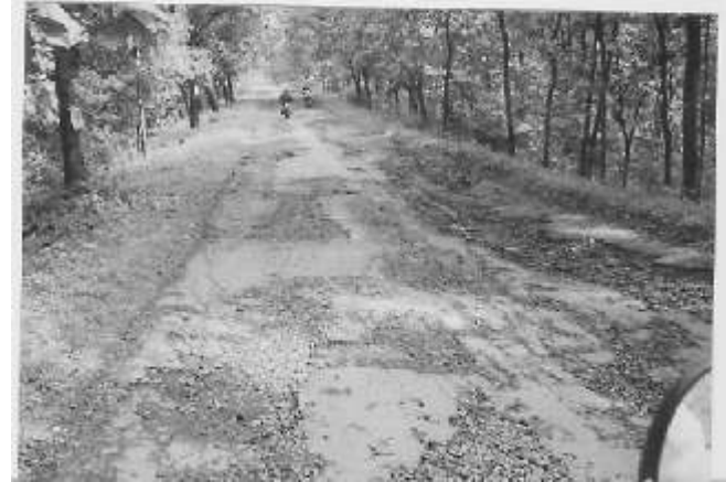
Otonomi daerah tidak serta merta menjadikan kondisi daerah lebih baik

supremasi hukum, pelayanan dasar yang merata dan terjangkau bagi publik, pembangunan ekonomi yang diarahkan untuk kesejahteraan sosial, terbukanya ruang publik untuk berpartisipasi, dan penguatan wacana publik, sehingga cita-cita democratic local governance dan atau local good governance bisa terwujud. Semoga! 🙏