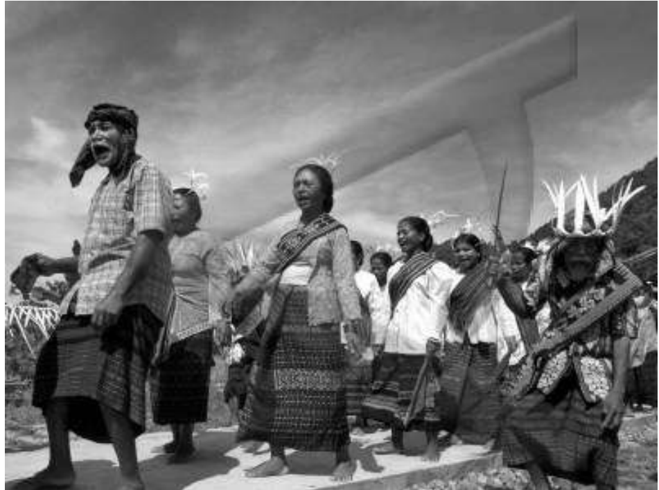
Masyarakat adat Flores NTT

Dalam konteks Indonesia, kesadaran akan buruknya dampak dari suatu usaha pertambangan terhadap perempuan selalu datang terlambat. Padahal kalau mau jujur, perempuan adalah kelompok yang paling rentan terkena dampak buruk dari hadirnya suatu usaha pertambangan. Menurut Mumtahanah (LBH-APIK) derita perempuan akibat industri tambang berlipat-lipat seperti, gangguan reproduksi (akibat pencemaran lingkungan dan air yang dikonsumsi), masalah produksi (seperti kasus